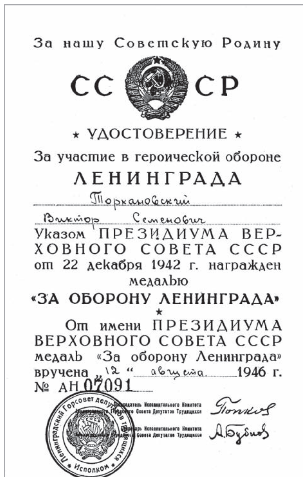
Удостоверение о награждении медалью «За оборону Ленинграда»