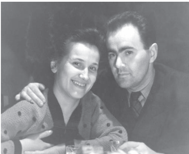
Первый год совместной жизни (1958 г.)