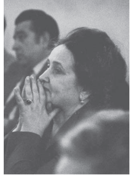
Суд совести. Правда о трагических событиях 1948–1950 гг.