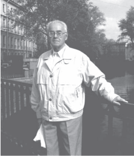
Около родного института