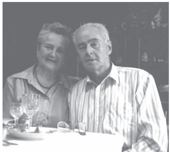
43 года спустя (2001 г.)